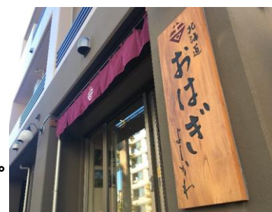
北海道おはぎ よしかわ

「つぶあんおはぎ」、「こしあんおはぎ」、「きなこおはぎ」、「ごまおはぎ」の四種類のおはぎをご用意しております。また四季折々の素材を使用したおはぎもございます。