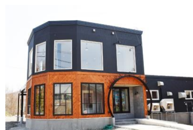
岩瀬牧場直営ジェラートショップ

北海道砂川市の広大な大地で、のびのびと育った乳牛200頭から搾った新鮮なミルクを使用し、プリンやチーズケーキ、ジェラートなどのスイーツを製造・販売しています。2012年には「ご当地アイスグランプリ」で全国42社・64アイテムの中から最高金賞を受賞しております。